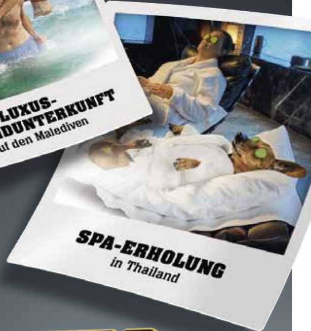
SPA-ERHOLUNG in Thailand