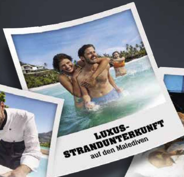
LUXUS-STRANDUNTERKUNFT auf den Malediven