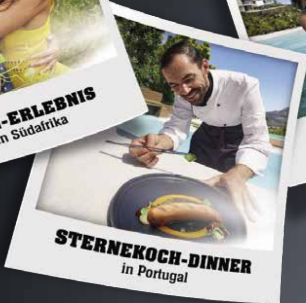
STERNEKOCH-DINNER in Portugal