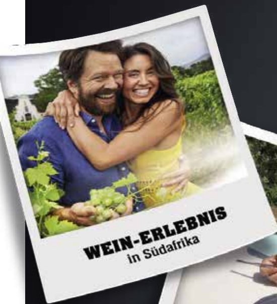
WEIN-ERLEBNIS in Südafrika