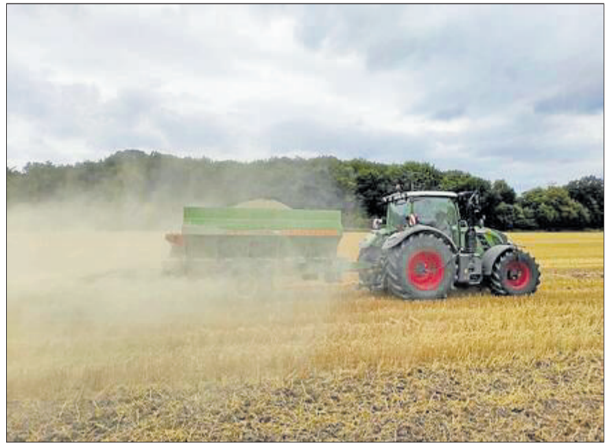
Da staubt es, wenn ein Trecker mit dem Kalkstreuer über den Stoppelfacker fährt.

Das sind die Gründe, weshalb man derzeit Trecker mit Kalkstreuern über die gelben Stoppelfelder fahren sieht. „Meist umgeben von einer großen Staubwolke“, fügt der Kreisverbandsvorsitzende hinzu.