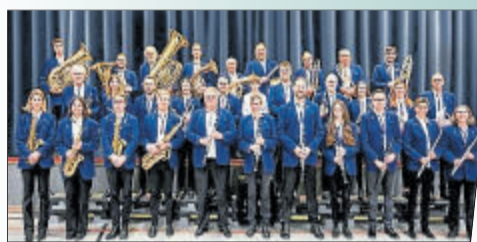
Für musikalische Unterhaltung sorgt das Lipperlandorchester gleich an mehreren Tagen.