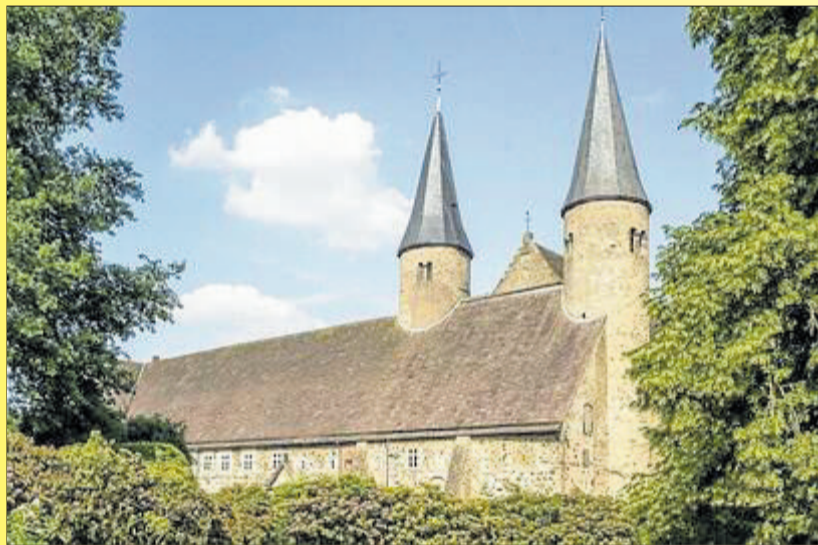
Das Kloster Möllenbeck bei Rinteln gehört zu den bedeutendsten Baudenkmalern im Weserbergland Niedersachsens.

feetrinken anzureisen. Es kann auch bei Bedarf eine Rückfahrt im Auto organisiert werden. Die Führung durch das Kloster erfolgt auf Spendenbasis. Um Anmeldung bis zum 29. August bei Annette Flörkemeier unter info@dorfleben-langenholzhausen.de oder unter Telefon 05264/69174 wird gebeten.