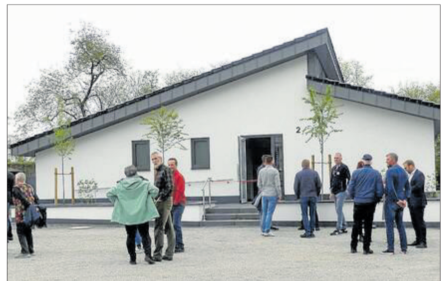
Das schicke Dorfgemeinschaftshaus in Selbeck kann beim Ziegler-Wettstreit von den Gästen begutachtet werden. Das Gebäude ist im April dieses Jahres eröffnet worden.

Am Samstag, 24. August, treffen sich die Helfer um 14 Uhr am Dorfgemeinschaftshaus. Beginn ist dann um 15 Uhr. Nähere Informationen über den Verein sind auch online auf www.zieglerverein-selbeck.de zu finden.