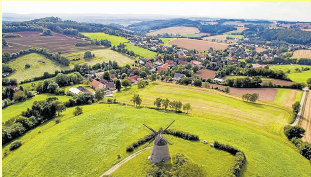
Kalletal aus der Vogelperspektive.