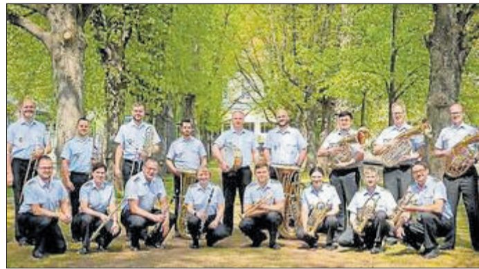
Die Egerländer-Besetzung des Heeresmusikkorps ist zu Gast im Pyrmontener Kurpark.

der Bundeswehr in Niedersachsen. Im großen Klangkörper, aber auch in kleiner Besetzung verleihen die Militärmusiker und -musikerinnen jeder Veranstaltung ihren besonderen Charakter. Bereits 2023 haben die Heeresmusiker, mit der Egerländerbesetzung, das Publikum zu wahren Begeisterungstürmen hingerissen. Die 20 Berufsmusiker haben sich der Pflege der mährischen und der böhmischen Blasmusik angenommen. Ein Vorbild ist Erich Mosch. „Aber auch die Freunde der traditionellen Marschmusik kommen wieder auf ihre Kosten“, verspricht Hauptfeldwebel Kai Kirschner, der das Orchester