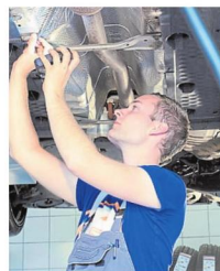
Das Kfz-Handwerk steht bei jungen Männern hoch im Kurs.