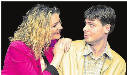
Der Komödienklassiker „Boeing Boeing“ feiert am 26. Februar Premiere in der Schauburg Ibbenbüren.