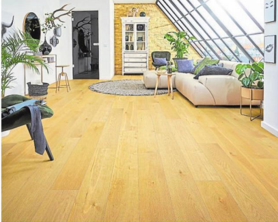
Ein hochrobuster Hartvinylboden kann selbst in Feuchträumen wie Bad und Küche problemlos verlegt werden. Dank seiner geringen Stärke und der besten Emissionsklasse VOC A+ ist er der optimale Bodenbelag für wohngesunde Renovierungsprojekte.

hlc. Was ist es, das einem Raum Charakter verleiht? Möbel, Beleuchtung und Deko helfen maßgeblich, aus vier Wänden ein Zuhause zu machen. Doch mindestens genauso wichtig ist der Einfluss der größten Einzelfläche im Raum: der Fußboden. Qualitätsanbieter haben zwei Varianten im Angebot, die sich durch ihre guten Materialeigenschaften und eine facettenreiche Dekor-Vielfalt als Allroundtalente für sämtliche Räume erweisen.