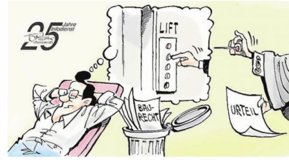
Der nachträgliche Einbau eines Fahrstuhls kann an einer fehlenden baurechtlichen Genehmigung scheitern. Grafik: obs/Bundesgeschäftsstelle Landesbausparkassen (LBS)

Interessierte finden alle Informationen zur Förderthematik auf der VFF-Info-Webseite fenster-können-mehr.de . Neben dem kostenlosen VFF-Fördermittel-Assistenten (dem Förderrechner) gibt es dort Erklärvideos und alle sonstigen Infos und Downloadmöglichkeiten. Zudem informiert die Seite über die Vorteile moderner Fensterlösungen, wie Energieeinsparung, Sicherheit, Schallschutz und Sonnenschutz.