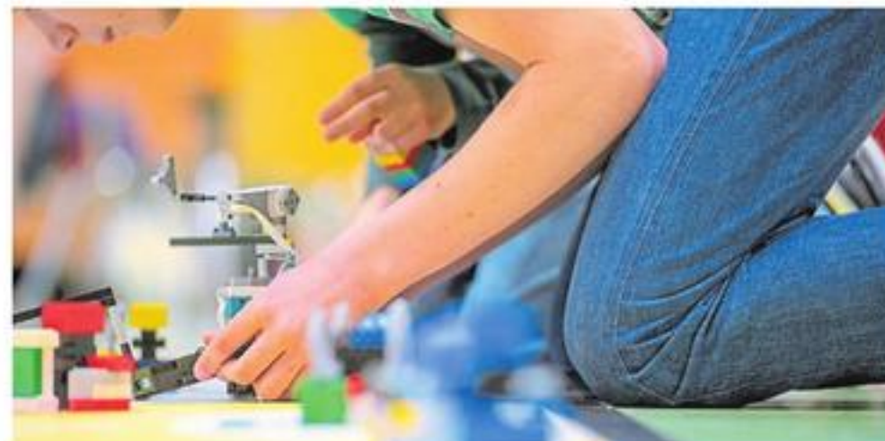
Einen niederschweligen und spielerischen Zugang zu Informatik und Robotik bietet der zdi-Roboterwettbewerb.

Der Klimawandel wird immer deutlicher spürbar, und eine weltweit wachsende Bevölkerung stellt die Gesellschaft zunehmend vor Herausforderungen. Um diesen Veränderungen gewachsen zu sein, müsse sich auch die Lebensmittelproduktion verändern, heißt es in der Mitteilung. Zu den Eckpfeilern dieser modernen Lebensmittelproduktion gehöre zum einen eine nachhaltige Landwirtschaft. Zum anderen seien innovative Technologien notwendig, etwa die vertikale Landwirtschaft (Vertical Farming), die besonders platz- und wassersparend ist, oder die Züchtung von Fleisch im Labor (In-vitro-Fleisch). Auch genoptimierte, wetterbeständige Getreidearten oder die Versorgung mit Proteinen über Insekten können zur nachhaltigen Lebensmittelversorgung beitragen.