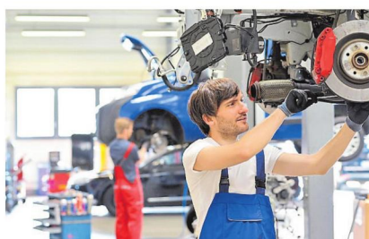
Keine Überraschung: Bei den Männern lag der „Kraftfahrzeugmechatroniker“ in der Rangfolge der beliebtesten Ausbildungsberufe auch 2024 klar an der Spitze.