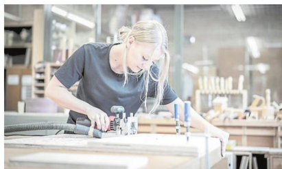
Tischlerin bei der Arbeit: Das Tischlerhandwerk gehört bei jungen Frauen zu den beliebtesten handwerklichen Ausbildungsberufen.