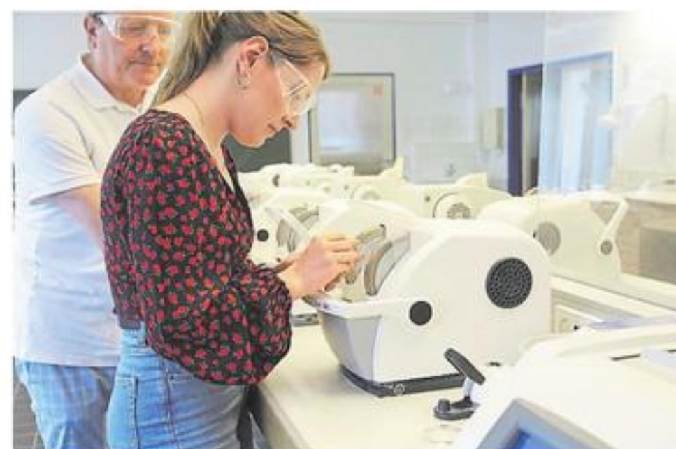
Brillenschliff, Reparatur und Anpassung – nur ein paar Dinge, die Augenoptiker-Auszubildende innerhalb von drei Jahren lernen.

gentlich eine Ausbildung machen und haben nur noch keinen Ausbildungsplatz“, erklärt der IHK-Bildungsexperte. Sie könnten auf diesem Weg noch einmal gezielt angesprochen und beraten werden. „Offene Ausbildungsplätze gibt es genug“, ergänzt er und empfiehlt, die Vermittlungsangebote von IHK, Handwerkskammer und Agentur für Arbeit zu nutzen.