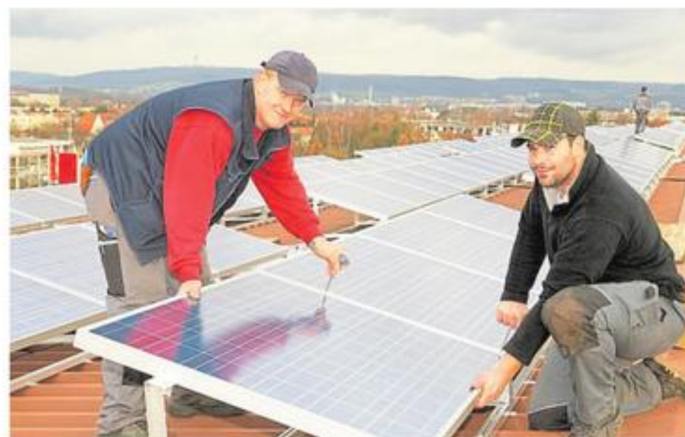
Sie spielen eine entscheidende Rolle beim Photovoltaik-Hochlauf: Das Installieren von Photovoltaik-Anlagen gehört mittlerweile ebenfalls zum Aufgabenbereich der Dachdecker.

beiten und einen Beitrag zum Klimaschutz leisten. Im Dachdeckerhandwerk haben sie dazu die perfekte Gelegenheit. Wir sind ein zentraler Treiber für den Ausbau erneuerbarer Energien und spielen eine entscheidende Rolle beim Photovoltaik-Hochlauf“, so Voges weiter. Schon 2016 wurde die Ausbildungsordnung aktualisiert und um den Schwerpunkt „Energietechnik an Dach und Wand“ erweitert. Seit 2024 gibt es zudem eine freiwillige Zusatzwoche in der überbetrieblichen Ausbildung, in der das Installieren von PV-Anlagen mit unterschiedlichen Systemen intensiv geübt wird. „So stellen wir sicher, dass unsere Azubis bereits während der Ausbildung auf dem neuesten Stand sind und bestens auf die Herausforderungen der Zukunft vorbereitet werden“, fasst Voges zusammen. Mit diesen positiven Entwicklungen zeigt das Dachdeckerhandwerk einmal mehr, dass es nicht nur ein traditionelles, sondern vor allem auch ein zukunftsorientiertes Gewerbe ist, das jungen Menschen attraktive Perspektiven bietet.