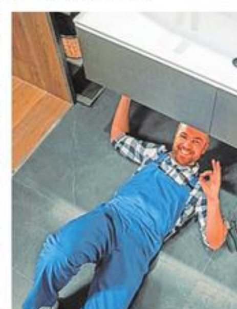
SHK-Handwerker helfen zum Beispiel dabei, Bäderräume umzusetzen.

Unter www.die-badgestalter.de/ jobs gibt es dazu weitere Infos sowie Stellen- und Ausbildungsangebote von über 130 Unter-