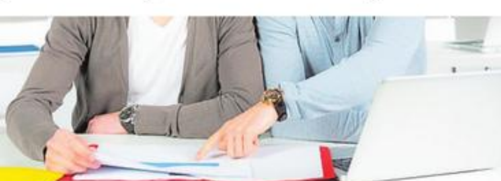
Gut ausgestattete Berufsschulen sind aus Sicht der Wirtschaft essenziell für die Stärkung der Beruflichen Bildung.

Die komplette Studie kann auf www.dihk.de/de/themen-und-positionen/fachkraefte/beschaeftigung nachgelesen oder heruntergeladen werden.