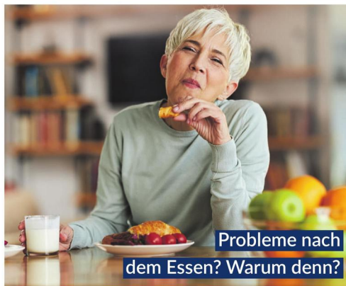
Probleme nach dem Essen? Warum denn?

Tropfen mit ihrer einzigartigen Kombination aus beruhigenden und bitterstoffhaltigen Heilpflanzen sorgen für schnelle Linderung. Direkt nach dem Essen eingenommen, aktivieren Bitterstoffe, z.B. enthalten in Wermut-, Benediktenkraut und Angelikawurzel, die Verdauungssäfte. 1,2 Krampflösendes Gänsefingerkraut, zusammen mit Süßholzwurzel und Kamillenblüten, entspannt den gesamten Magen-Darm-Trakt.