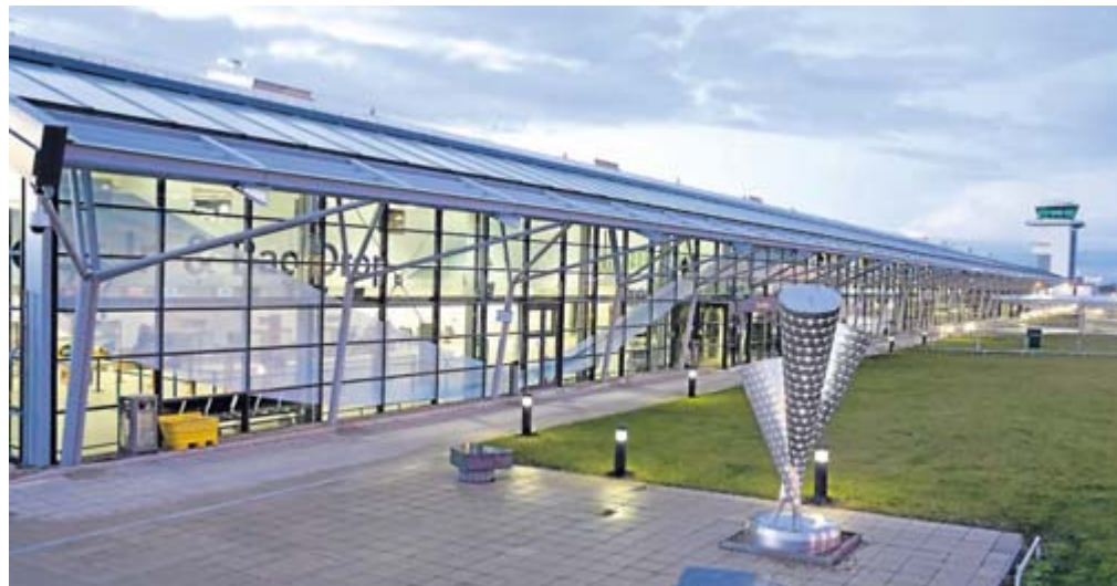
Southend – hier das Terminal – ist der neueste Londoner Flughafen. Kürzlich wurde er als bester Airport Großbritanniens ausgezeichnet.