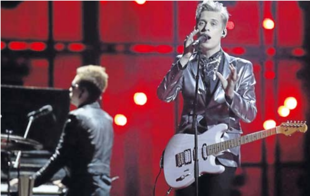
Die Finnen von „Softengine“ lassen Teenie-Herzen höher schlagen.