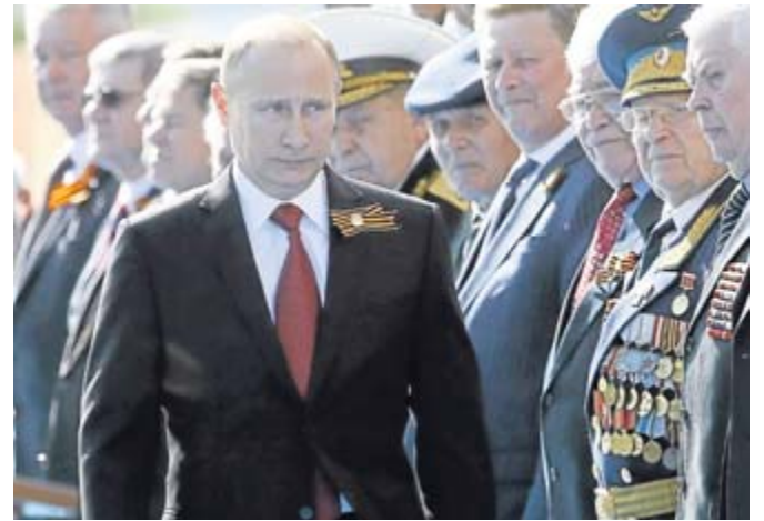
Wladimir Putin hier noch in Moskau bei der Parade.

Wie im russischen Fernsehen zu sehen war, fuhr Putin