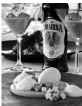
Amarula Panna Cotta

Viele verbringen Ostern mit ihrer Familie oder laden Freunde ein. In geselliger Runde werden die Gäste gern mit einem leckeren Ostermenü verwöhnt. Sie sind noch auf der Suche nach einem Nachtisch, der schnell zuzubereiten ist und etwas Abwechslung auf die Ostertafel bringt? Probieren Sie doch einmal Panna Cotta mit Amarula Cream Likör und begeistern Sie Ihre Gäste mit südafrikanischem Flair.