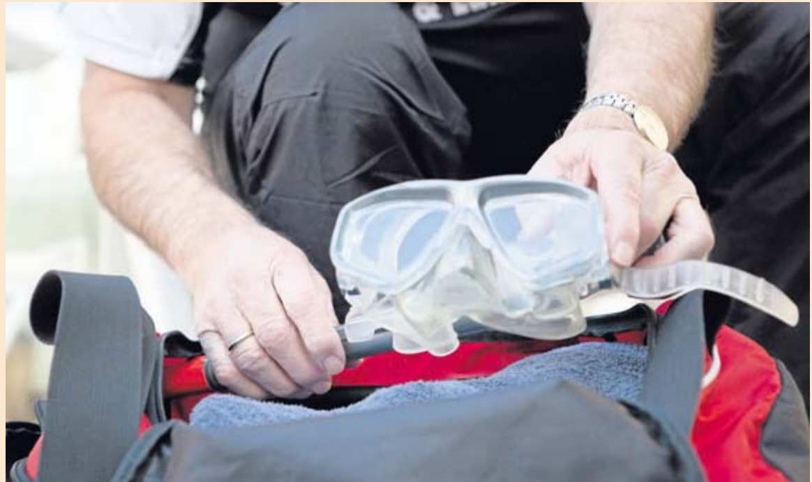
Wer im Alter geistig abbaut, muss den Sport nicht aufgeben. Schwimmen, Tanzen oder Wandertouren tun De- menzkranken meist richtig gut.