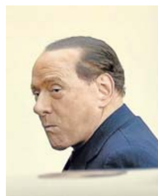
Silvio Berlusconi bei der Ankunft am Seniorenheim.

Internationaler Medienauftrieb vor dem Zentrum begleitete Berlusconis Ankunft. Dutzende TV-Kameras versuchten ohne großen Erfolg, Bilder einzufangen. Ein laut rufender Berlusconi-Gegner wurde abgedrängt. Die Sicherheit war an den Eingängen des Zentrums verstärkt