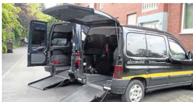
„alexmobil“ ist bei allen Krankenkassen zugelassen und hat für seine Kunden ein großes Leistungsangebot.

Zu den Leistungen gehören unter anderem Kranken-, und Behinderten- sowie Kur- und Reha-Fahrten. Zwei der insgesamt fünf Fahrzeuge sind für Rollstuhlfahrer geeignet und stehen den Kunden auch am Wochenende und an Feiertagen zur Verfügung.