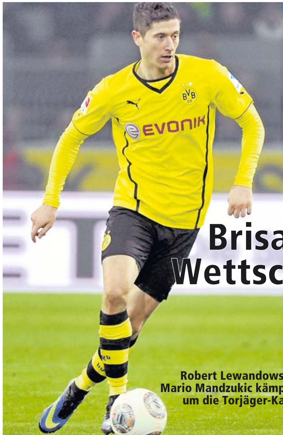
Robert Lewandowski Mario Mandzukic kämpfen um die Torjäger-Kanone

DÜSSELDORF. In der kommenden Saison sollen sie um einen Stammplatz im selben Verein kämpfen, beim Finale dieser Spielzeit konkurrieren sie im Fernduell um die Torjäger-Kanone. Dem Dortmunder Robert Lewandowski und dem Münchner Mario Mandzukic steht ein brianter Bundesliga-Showdown bevor.