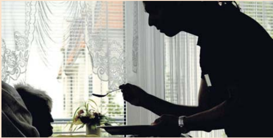
Pflegekräfte sollen entlastet werden, indem sie weniger Papierkram zu erledigen haben.