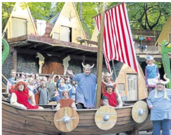
Wickie und seine Freunde aus Flake müssen wieder viele Abenteuer bestehen.

Nach vielen Wochen mit intensiver Probenarbeit fiebern die über 50 kleinen und großen Darsteller ihrem ersten Auftritt entgegen. Die Zuschauer können sich auf farbenfrohe Kostüme, ein phantasievolles Bühnenbild, tolle Musik und beste Unterhal-