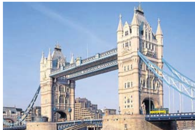
Die Tower Bridge ist eines der beliebten touristischen Ziele in London.