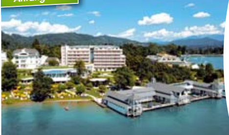
Hotelbeispiel: 4****Werzer's Hotel Resort am Wörthersee