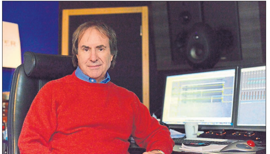
Chris de Burgh tritt am 20. Juli im Schlosspark Wilhelmsthal auf.

Karten im Vorverkauf gibt es unter anderem in der Geschäftsstelle des WESTFALLEN-BLATTES, Kalandstraße 17, in Warburg.