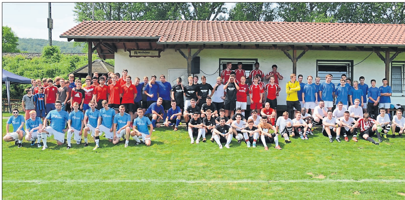
Die Stadtgruppe Willebadessen lädt alle Fußballbegeisterten für Samstag, 12. Juli, zum KSJ-Cup auf den Sportplatz Borlinghausen ein. Das Foto zeigt die Mannschaften aus dem vergangenen Jahr.