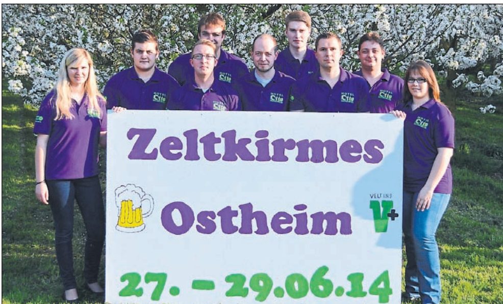
Die Kirmesburschen und -mädel aus Ostheim freuen sich auf viele gut gelaunte Besucher bei der Zeltkirmes, die vom 27. bis zum 29. Juni gefeiert wird.