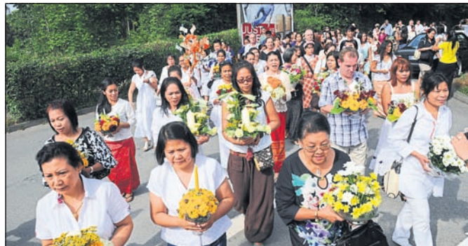
Die buddhistische Prozession mit Übergabe der Spendenbäume und der monetären Gaben an die Mönche gehört zu den Höhepunkten des Einweihungsfestes. Unser Foto entstand im Spätsommer 2013.

nach eigenem Bekunden sehr wohl in der Hansestadt: »Wir sind hier angekommen. Es ist toll, dass uns viele Menschen auf den Straßen so freundlich grüßen. Warburg ist eine schöne Stadt.«