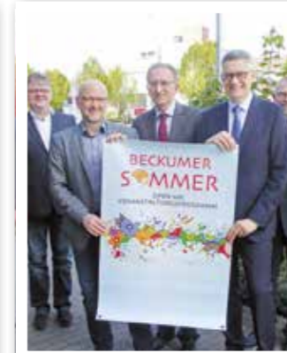
Beckumer Sommer Seite 8