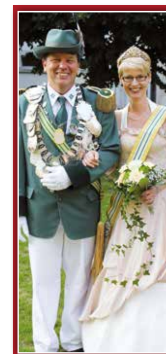
Wir möchten uns für einen falschen Bildnachweis in der Juliausgabe der Ortszeit entschuldigen. Das Bild des Königspaares wurde von Susann Zwehn gemacht.

Viel Vergnügen wünscht, Ihr Team der Ortszeit Ahlen/Beckum.