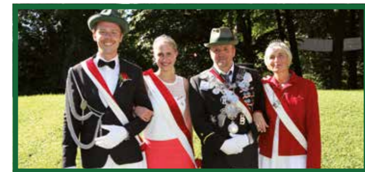
Die amtierenden Königspaare der St. Sebastian Schützengilde e.V. Beckum