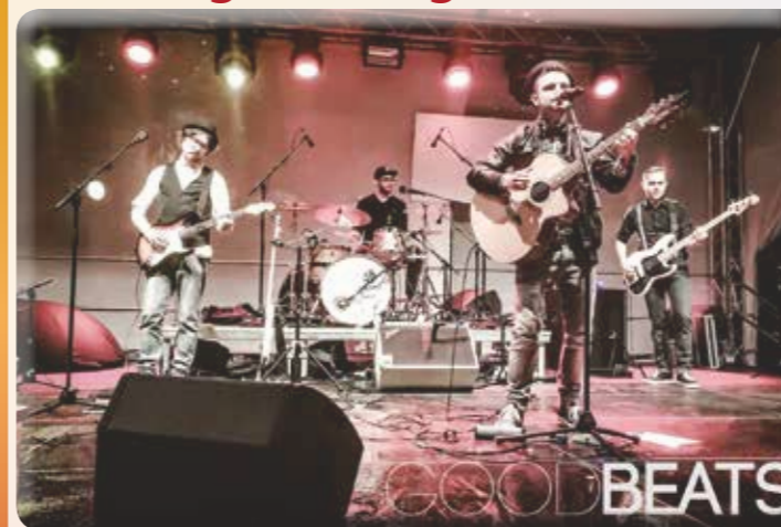
Zum Abschluss des Musikprogramms gastieren Goodbeats am Samstag 20. August, um 21 Uhr, auf dem Beckumer Marktplatz. Die Band interpretiert bekannte Songs auf ihre ganz eigene Art und zaubert so einige Lieder hervor, die so noch nicht zu hören waren.