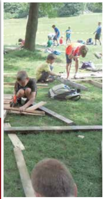
Die Beckumer Ferierspieltage bieten den Kindern ein breit gefächertes Angebot und die Möglichkeit kreativ zu werden.

In der Woche vom 6. bis 12. August finden im Aktivpark Phoenix wieder die beliebten Ferierspieltage statt. Zum 40. Mal veranstalten das Phönix-Team-Beckum e. V. und die Stadt Beckum gemeinsam ein spannendes Programm für Beckumer Kinder.