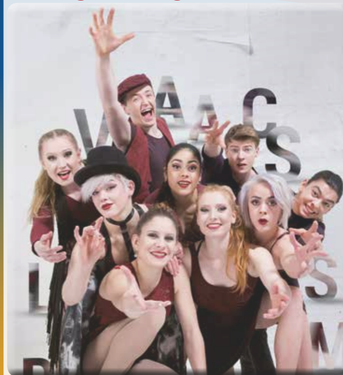
„Bühne frei“ heißt es am Freitag, 12. August, um 20 Uhr, für die Absolventenshow der Staatlichen Artistenschule Berlin 2016 auf dem Rathausvorplatz in Neubeckum. Unter dem Motto „INITIAL“ starten die jungen Artistinnen und Artisten eine außergewöhnliche und begeisternde Show lebendiger Körperkunst.