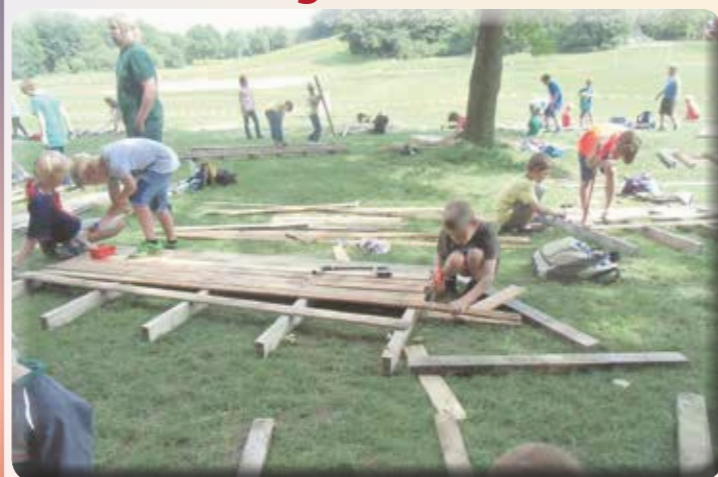
In der Zeit vom 6. bis 12. August können sich alle Kinder wieder auf die vom Phönix Team Beckum e.V. und dem Fachdienst Kinder-, Jugend- und Familienförderung der Stadt Beckum organisierten Ferienspieltage im Aktivpark Phoenix freuen.