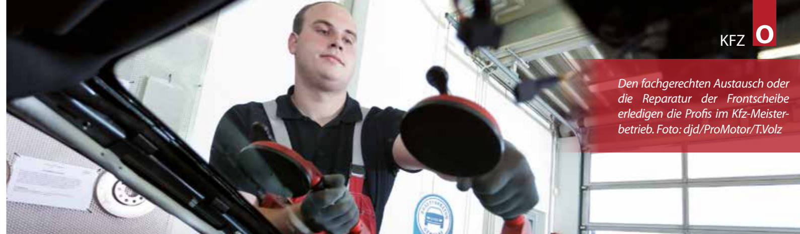
Den fachgerechten Austausch oder die Reparatur der Frontscheibe erledigen die Profis im Kfz-Meisterbetrieb.