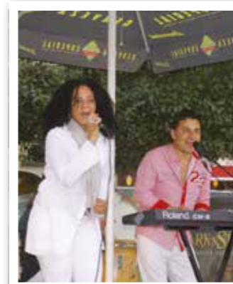
Ahlen karibisch Seite 5