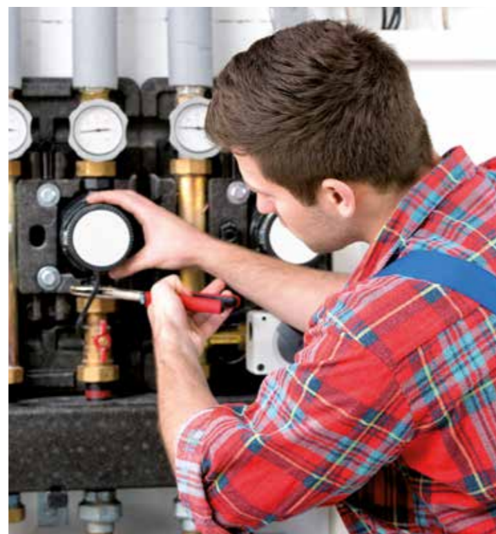
Alte Heizungen belasten die Haushaltskasse. Und ein Heizungstausch vom Profi ist meist schneller und kostengünstiger als viele Immobilienbesitzer vermuten.

In Deutschland bieten mehr als eine Million Handwerksbetriebe mit über fünf Millionen Beschäftigten und rund 380.000 Auszubildenden ihre Dienste an. Das Handwerk erwirtschaftet einen Jahresumsatz von 533 Milliarden Euro und