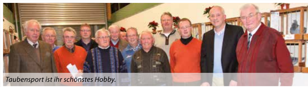
Taubensport ist ihr schönstes Hobby.

Aufgrund eines Ausschlusses aus der Reisevereinigung (RV) Neubeckum wurde am 23. Januar 1953 die RV Beckum gegründet.