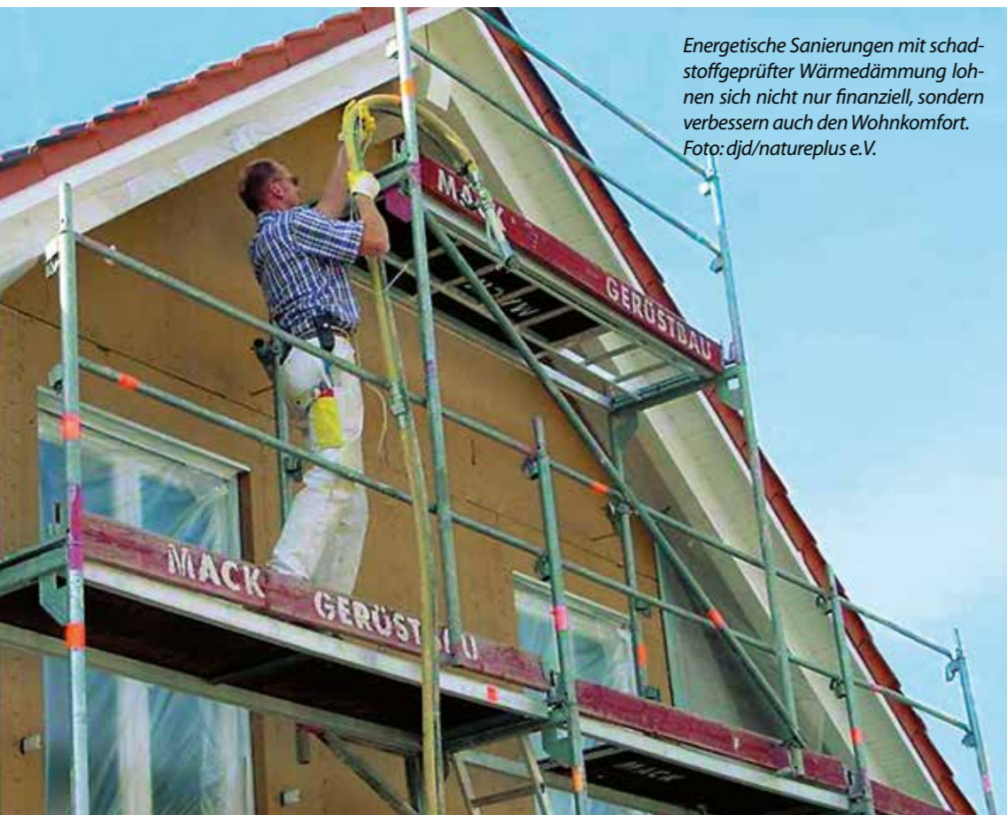
Energetische Sanierungen mit schadstoffgeprüfter Wärmedämmung lohnen sich nicht nur finanziell, sondern verbessern auch den Wohnkomfort.