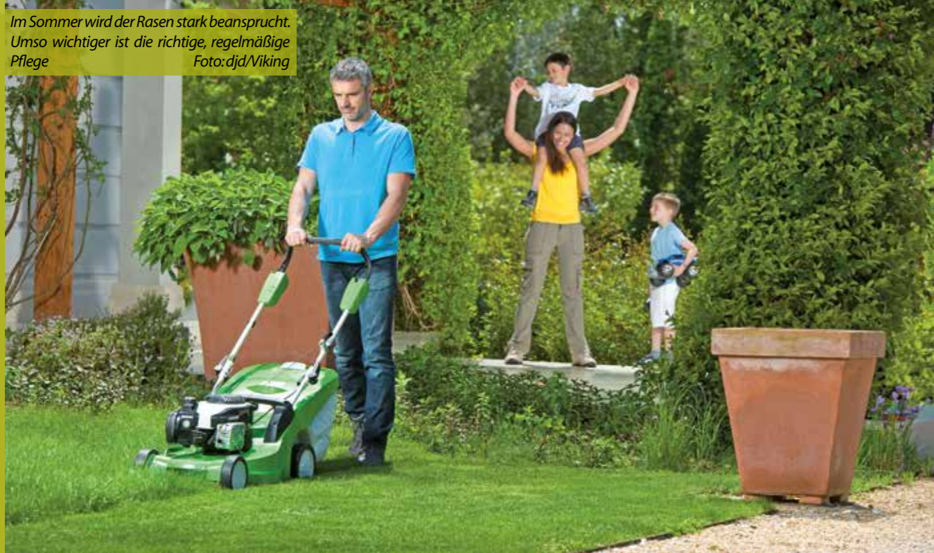
Im Sommer wird der Rasen stark beansprucht. Umso wichtiger ist die richtige, regelmäßige Pflege.

Mähen, mulchen, wässern: Expertentipps zur Pflege in der warmen Jahreszeit