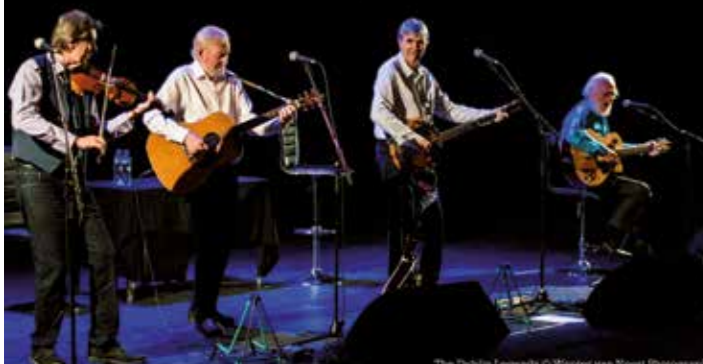
The Dublin Legends bieten Irish Folk vom Feinsten.

Sichern Sie sich jetzt Ihre Tickets für den erfolgreichsten Export Irlands seit der Erfindung von Whiskey. Die Eintrittskarten sind zum Preis von 32,00 € / 38,00 € / 43,00 € im Vorverkauf der Stadthalle Ahlen, Telefon 0 23 82 – 20 00 und bundesweit bei allen ADticket-Vorverkaufsstellen erhältlich.