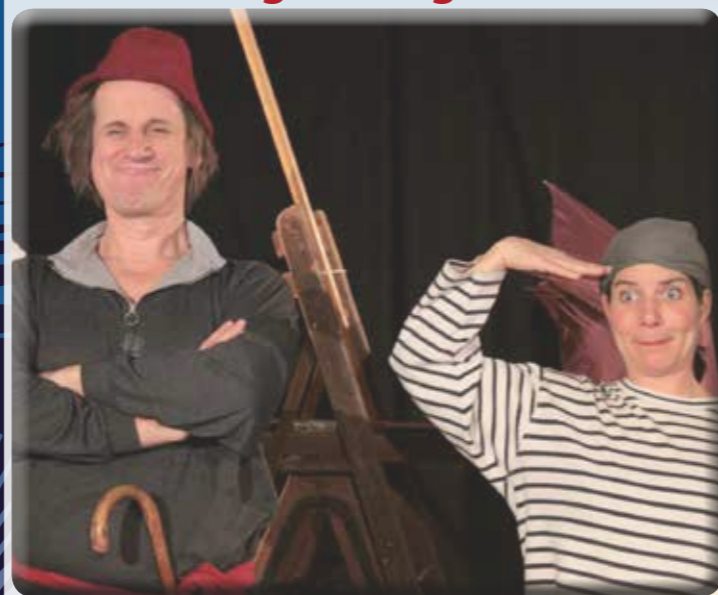
Am Donnerstag, 4. August, nimmt die Theaterkiste Kinder ab 6 Jahren mit auf eine Pirateninsel. Das kurzweile Zwei-Personen-Stück findet um 16 Uhr auf dem Beckumer Marktplatz statt.