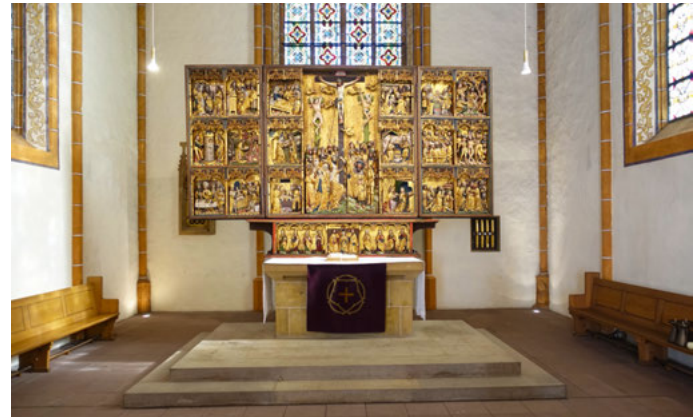
Der blattgoldverzierte Altar in der Stiftskirche