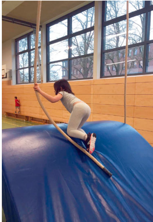
Kinder brauchen Bewegung: An verschiedenen Grundschulen im Stadtbezirk organisierte der SCB Sportangebote