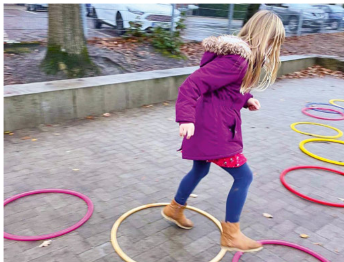
Bewegung auf dem Schulhof: Der SCB hat dazu ein Outdoor-Format entwickelt

E-Mail: info@intumove.de WhatsApp: 0157 54767137