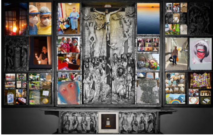
Zahlreiche Fotos wurden von Menschen aus Schildesche und Umgebung für das Schildescher Hungertuch zur Verfügung gestellt

aktuellem Bezug im Kirchoraum darzustellen und zu erfahren. Das ermöglicht auch gerade in Anbetracht des gegenwärtigen Verzichts auf Präsenzgottdienste (Stand Anfang März 2021) einen Zugang zur Passionsgeschichte für die Gegenwart“, beschreibt Rüdiger Thurm die Motivation für das Projekt. Zu Ostern ist der Altar wieder voll sichtbar und kann in seiner Schönheit bewusst neu wahrgenommen werden. „Dieser Wechsel erinnert uns auch daran, dass der Schildescher Altar im Mittelalter geöffnet und geschlossen werden konnte und mit mehreren Flügelpaaren ganz unterschiedliche Wirkung im Raum entfalten konnte“, so der Pfarrer weiter.