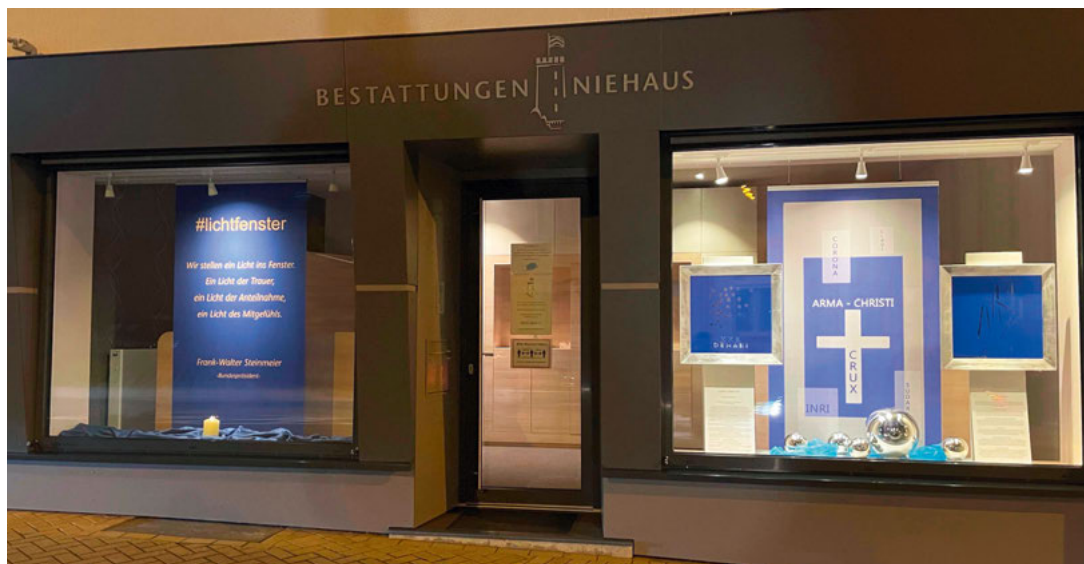
Das Licht in den Schaufenstern von Niehaus Bestattungen betont, wie wichtig jeder einzelne Corona-Verstorbene ist.