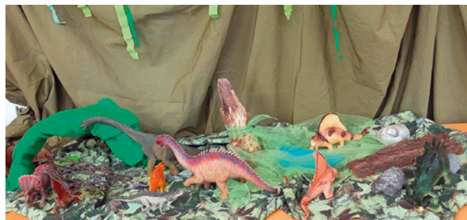
Auf den Spuren der Dinosaurier

Corona beschäftigt nur die Erwachsenen, wird man durch die Kinder eines Besseren belehrt. Auch sie äußern immer wieder gegenüber den Erzieherinnen ihre Gedanken und Sorgen wie zum Beispiel: „Ich bin sauer über Corona, weil es Leute krankmachen kann und Leute sterben können. Auch meine Oma kann daran sterben. Es macht auch die Geschäfte tot“, sagt ein fünfjähriges Kind. „Ich hasse Corona. Ich darf nicht mehr meine Freunde treffen“, äußert ein vierjähriges Mädchen. „Ich wünsche mir, wenn Sommer ist, dass Corona vorbei ist. Es dauert schon soo lange.“ (6 Jahre), „Ich will mal wieder zum Kinderturnen, zusammen mit meiner Cousine. Und in den Spielzeugladen.“ (3 Jahre), „Ich finde Corona blöd. Da muss man viele Regeln einhalten und viel zu Hause bleiben.“ (5 Jahre), „Ich möchte am liebsten eine Coronafalle bauen“ (5 Jahre), „Wir brauchen Lösungen“ (6 Jahre), so die Äußerungen einiger Kita-Kinder. Trotz der alles andere als erfreulichen Situation lassen sich die Erzieherinnen und Kinder nicht unterkriegen. Im Gegenteil: Zur-