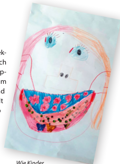
Wie Kinder das Coronavirus sehen: Menschen mit Maske

ausschöpfen können. Aus Infektionsschutzgründen dürfen sich die 49 Kinder der beiden Gruppen nicht mischen. Auch die im Haus tätigen Pädagogen sind den Gruppen streng zugeteilt und dürfen nicht innerhalb des Hauses wechseln. Dies erfordert viel organisatorisches Geschick und schränkt natürlich auch die Angebotspalette der pädagogischen Arbeit sehr ein. Wenn man glaubt, das Thema