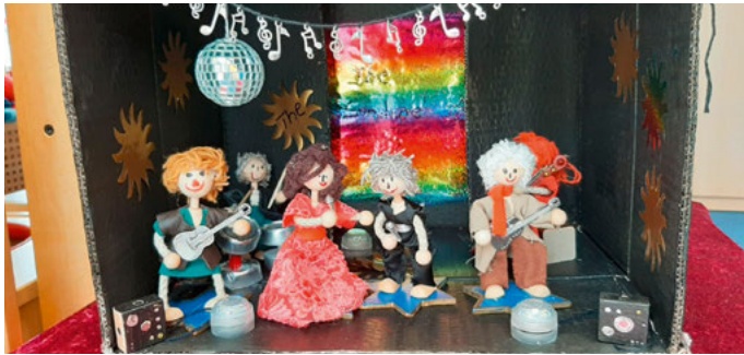
Kita-Kinder musikalisch: Aus einem Karton wurde eine Bühne kreiert