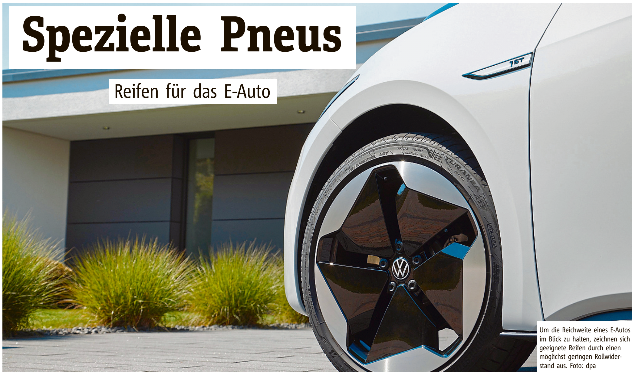
Um die Reichweite eines E-Autos im Blick zu halten, zeichnen sich geeignete Reifen durch einen möglichst geringen Rollwiderstand aus.