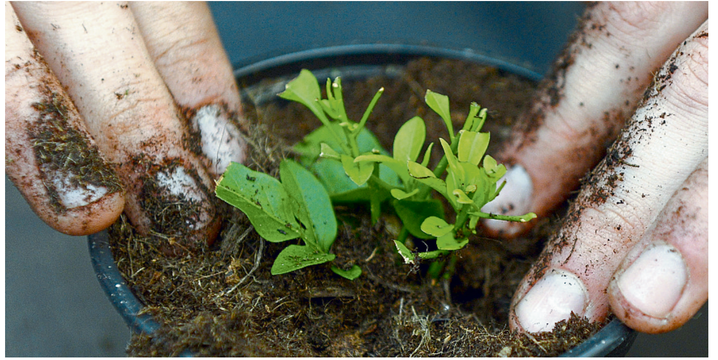
Etwas Fingerspitzengefühl kann beim Umtopfen von Jungpflanzen in frische Erde helfen.

Scheel: Um den Einkauf zu erleichtern – und damit der Kunde glaubt, dass er mehre-