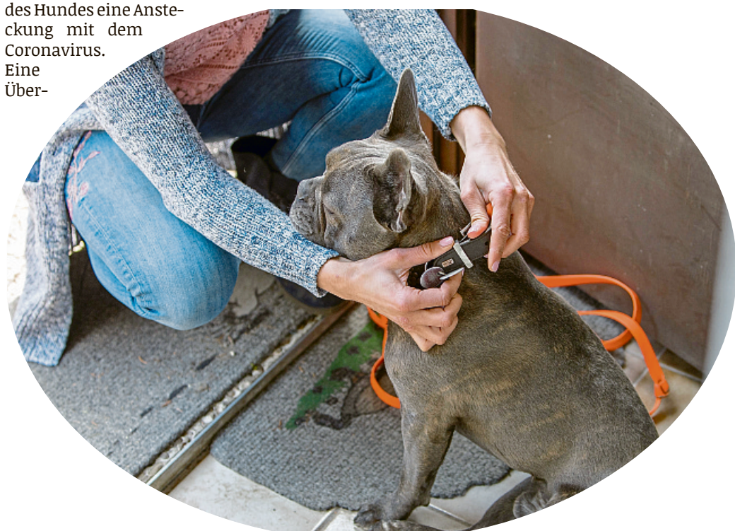
Eine Runde Gassi bitte: Wenn Halter krank oder verhindert sind, ist es gut, wenn Freunde einspringen können.

sion zur Seite legen.“ Denn nicht immer können oder wollen Familie oder Freunde die Betreuung mehrere Tage lang übernehmen. (dpa)