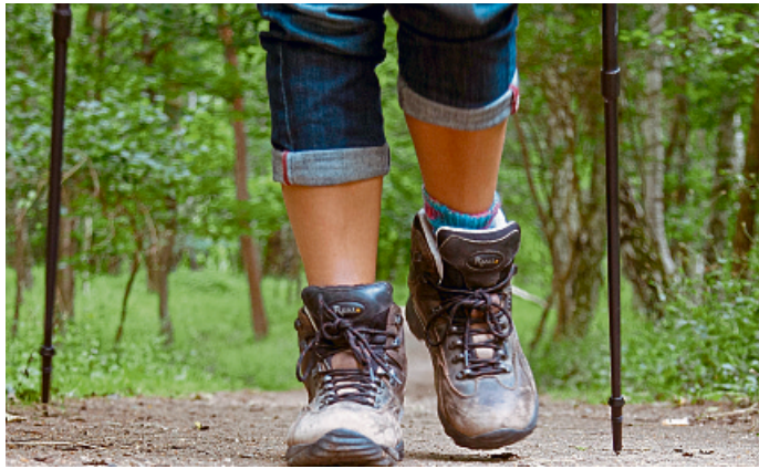
Wanderschuhe aus Leder erleben ein Comeback. Damit das Material nicht spröde wird, sollten sie zum Trocknen nicht in die Sonne oder in den Ofen gestellt werden.

Leder gilt als langlebig, ökologisch, gesund und bequem. Auch bei Outdoor-Schuhen erlebt das vielseitige Naturmaterial ein Comeback. Werden sie richtig gepflegt, können sie viele Jahre halten.