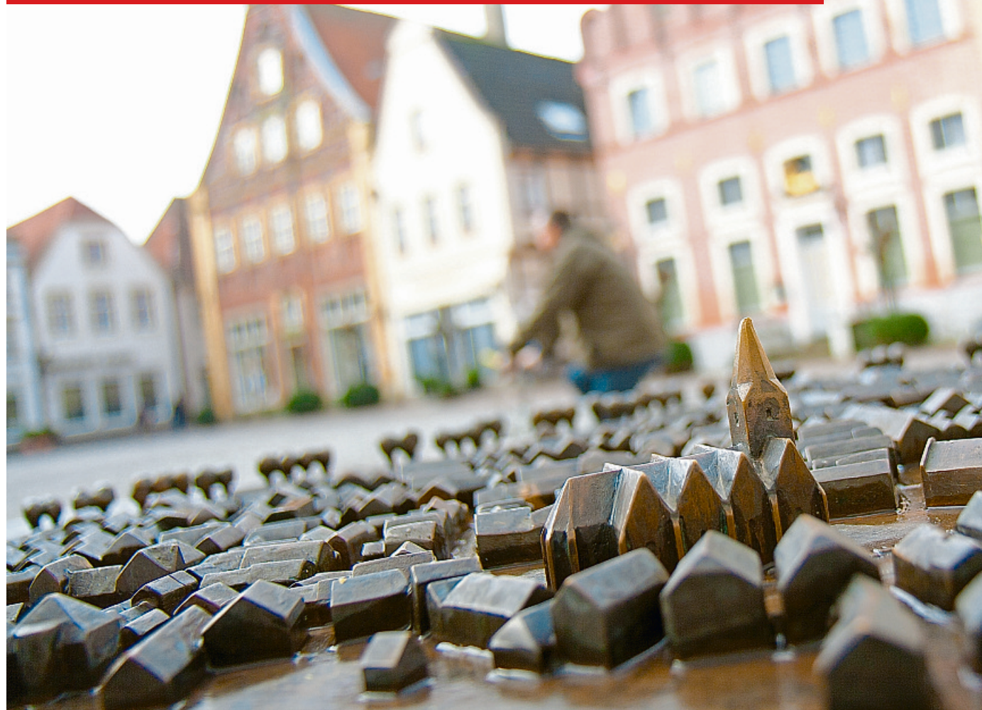
Intervention statt Investition: So lautet die Devise zur Bekämpfung der Leerstände in Warendorf.