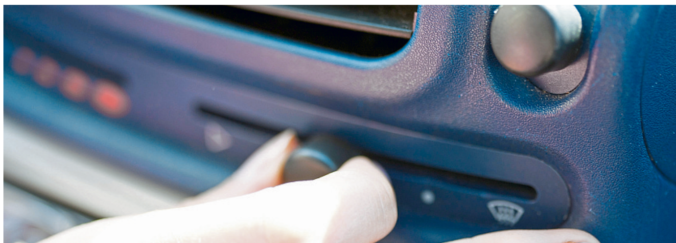
So saubere Luft wie möglich: Besonders Pollenallergiker lassen vor der Saison besser den Innenraumluftfilter tauschen.

Das sah das Gericht anders: Zwar werde das Halten in der Hand regelmäßig in der Praxis sowie in der Begründung für die Regelung vorausgesetzt, ausdrücklich sei diese Formulierung in der Vorschrift selbst aber nicht enthalten. Mit einer Freisprech-einrichtung ist das Einklemmen demnach nicht zu vergleichen. Man hat zwar auch dabei die Hände am Lenkrad. Aber die Bewegungsfreiheit ist stark eingeschränkt – etwa für einen Blick in den Rückspiegel oder einen Schulterblick. (dpa)