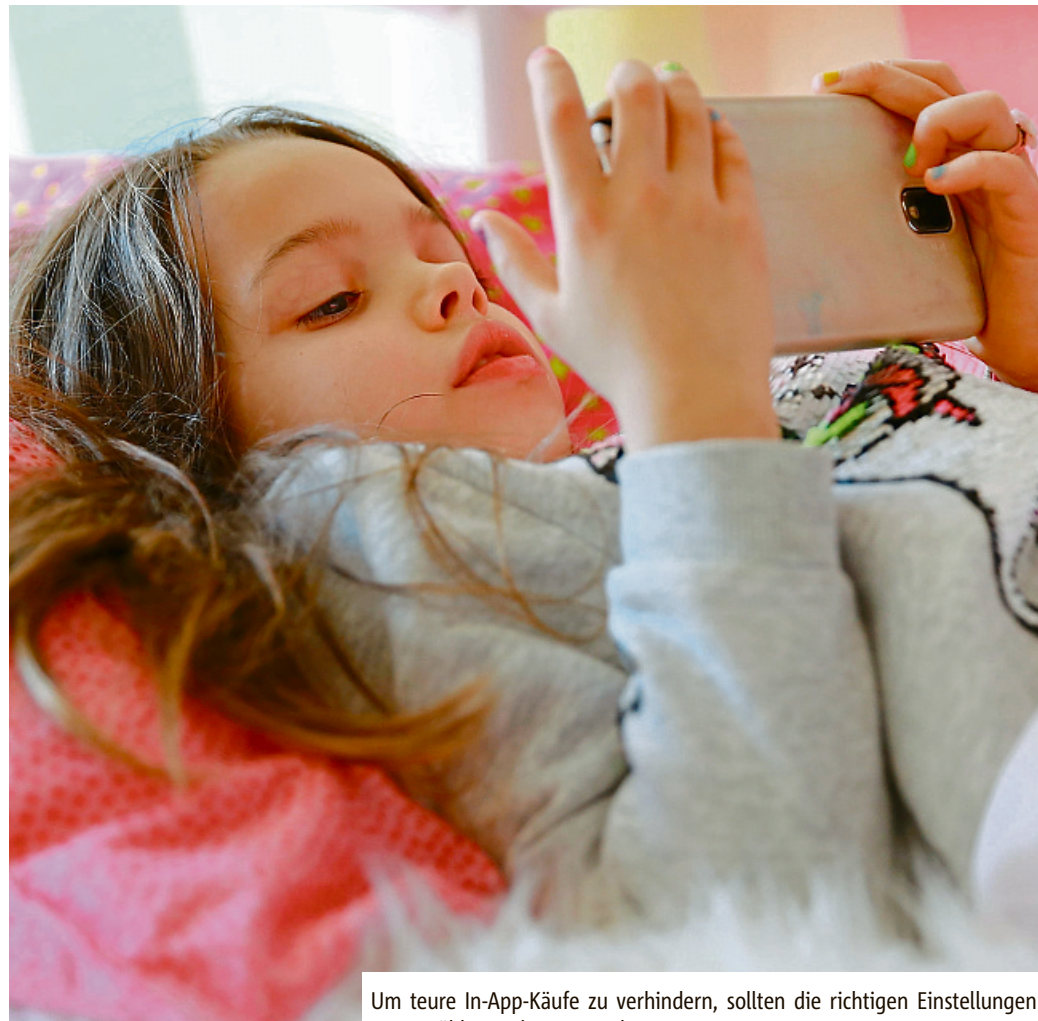
Um teure In-App-Käufe zu verhindern, sollten die richtigen Einstellungen ausgewählt werden.

Damit ein Kind diese Bildschirmzeit-Beschränkung nicht selbst deaktiviert, ist ein Code unter „Bildschirmzeit-Code verwenden“ nötig. Wird die Bildschirmzeit auf dem Gerät des Kindes eingerichtet, folgt man den Anweisungen des Betriebssystems