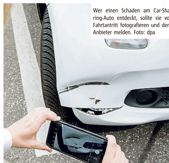
Wer einen Schaden am Car-Sharing-Auto entdeckt, sollte sie vor Fahrtantritt fotografieren und dem Anbieter melden.

zer, um Unannehmlichkeiten schon im Vorfeld vermeiden. (dpa)