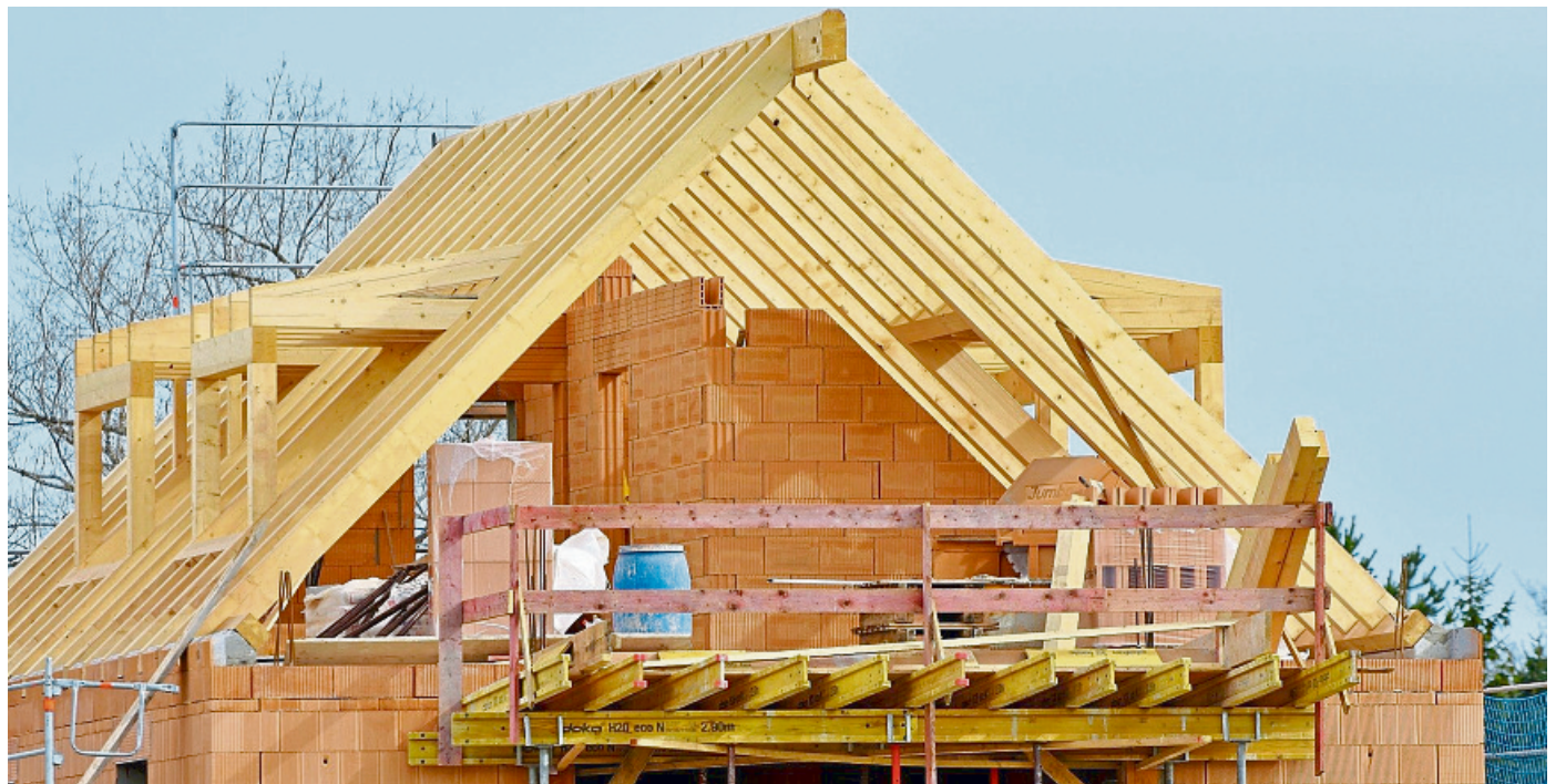
Steigende Baupreise durch die schlechte Versorgung mit Baumaterialien wie beispielsweise Holz bereiten dem Handwerk Sorge.