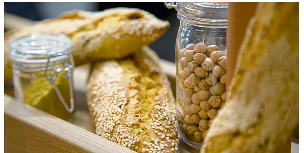
Wer kein separates Rezept für Baguette aus Kichererbsenmehl hat, sollte höchstens 25 Prozent des herkömmlichen Weizenmehls im herkömmlichen Rezept durch das proteinreiche Kichererbsenmehl ersetzen.

Ist die Brühe zu trüb geraten? „Eiweiß hilft, sie zu klären“, so Sasse. Mit dem Klären verstärkt man sogar deren Eigengeschmack. Das Ergebnis ist dann eine Consommé, also eine Kraftbrühe. (dpa)