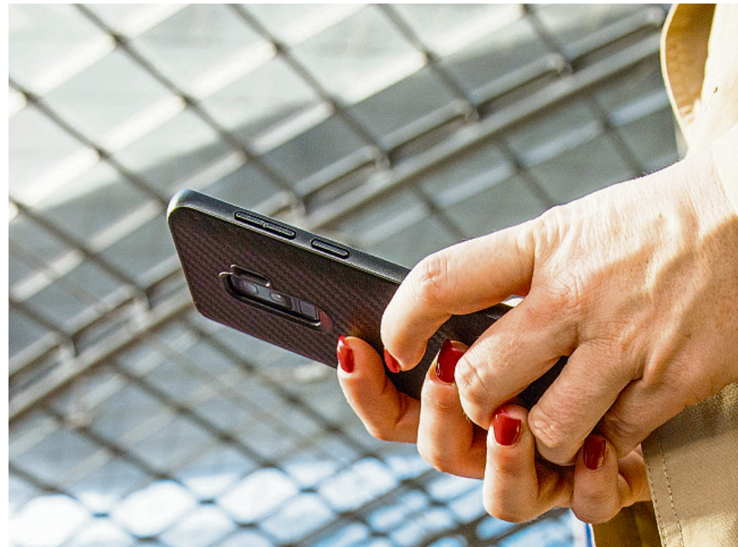
Privates soll privat, Vertrauliches vertraulich bleiben: Wer eine windige Mail-App nutzt, kann sich dessen nicht mehr sicher sein.

Neun Apps lasen im Test zwar keine E-Mail-Inhalte aus, banden aber Werbung und Tracking ein und über-