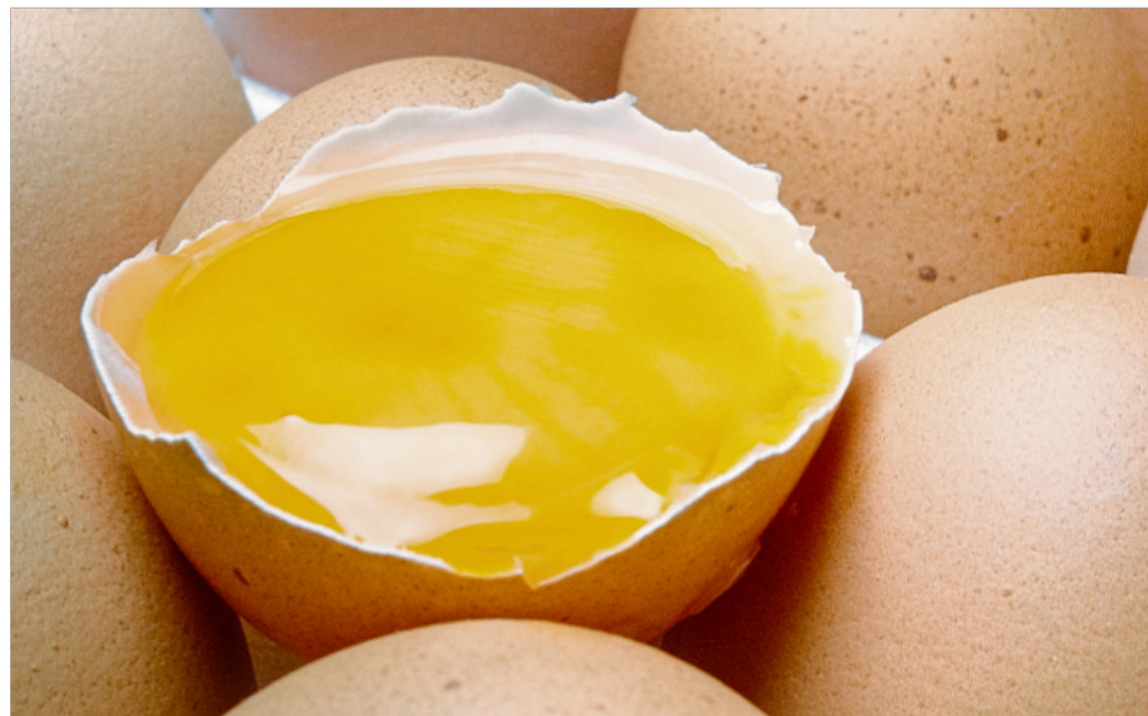
Während sich zusätzliches Eidotter gut in Waffeln, Pfannkuchen oder einer Sauce für Spaghetti Carbonara unterbringen lässt, kann überschüssiges Eiweiß in Baiser, Kraftbrühe oder einer Panade verwertet werden.

eigene Rezepturen. Die Spezialmehle eignen sich vor allem für Flachgebäcke wie Pfannkuchen, Wraps, Kekse oder Blechkuchen. (dpa)