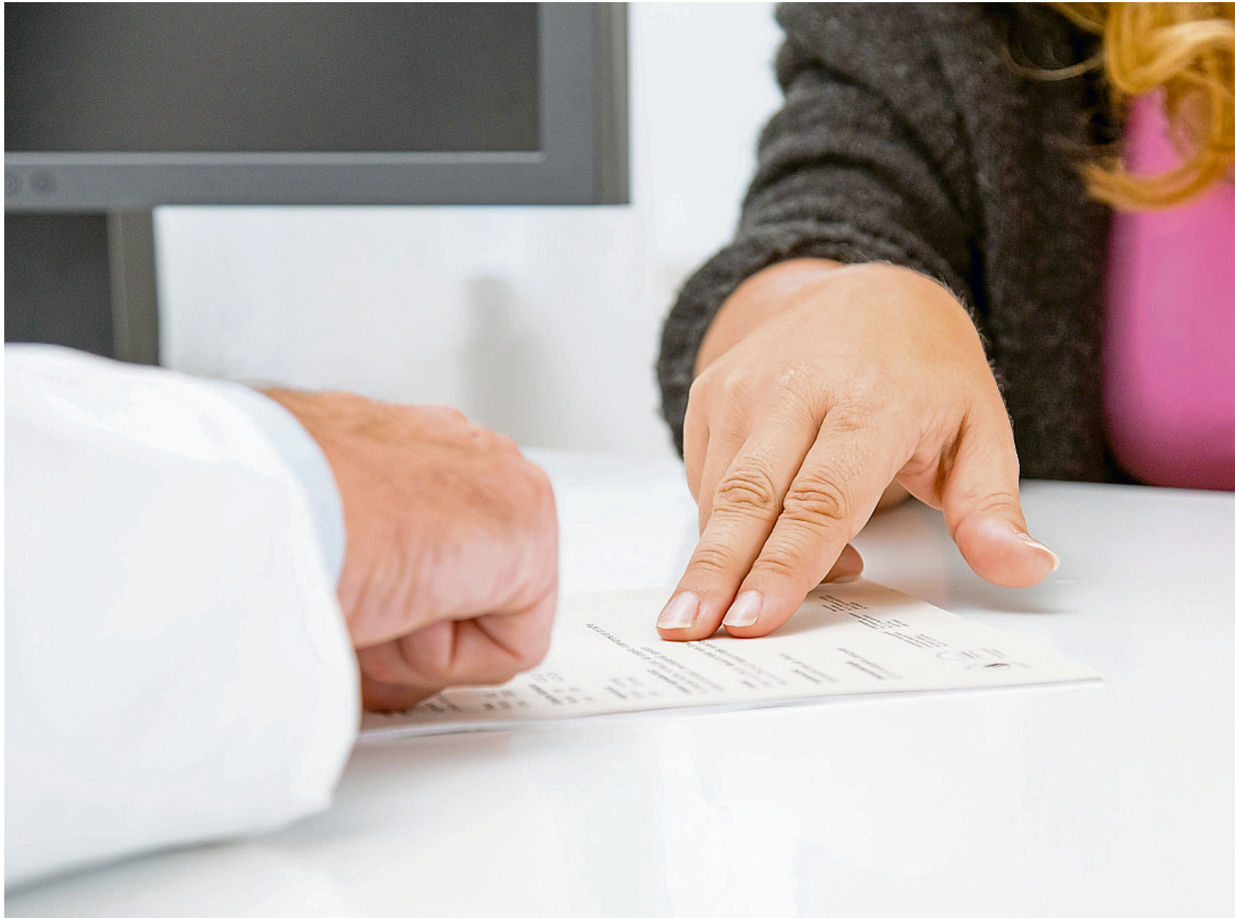
Fällt der Test auf HP-Viren positiv aus, wird in der Folge enghmaschiger kontrolliert als bei einem negativen Befund.