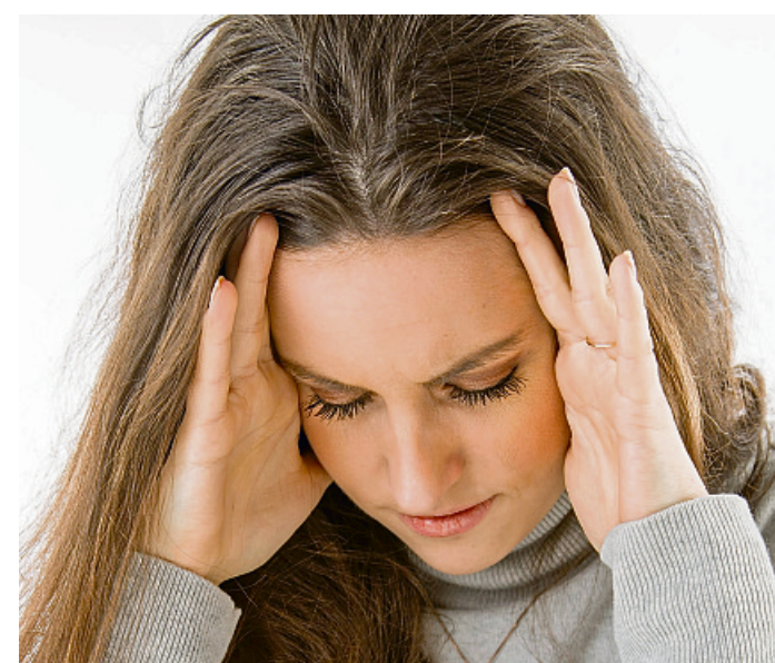
Auch bei Kopfwweh sollte man nicht zu oft zu Schmerzmitteln greifen.

der 10-20-Regel gemacht“, so Emrich. Das bedeutet konkret, dass Betroffene nur maximal an zehn Tagen im Monat zu Schmerzmitteln greifen und im Umkehrschluss an mindestens 20 Tagen im Monat darauf vollends verzichten sollten. Die Menge und Dosierung des Mittels an den Tagen, an denen man es nimmt, spielt hingegen laut dem Bericht eine untergeordnete Rolle. (dpa)