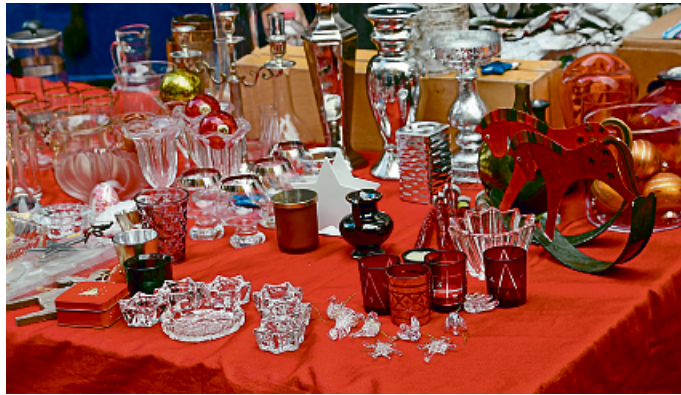
Schätze vom Trödel.

Und das Angebot ist vielfältig: Spielzeug, Kleidung,