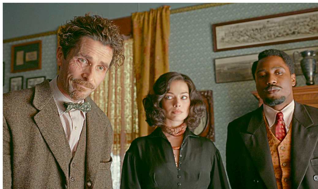
Christian Bale, Margot Robbie und John David Washington sind Dreh- und Angelpunkt des spielreudigen Casts von „Amsterdam“.

Was dann folgt ist eine kuriose Verkettung von Ereignissen und Begegnungen mit Personen, mit deren Hilfe die Kriegsfreunde nicht nur ihre Unschuld beweisen wollen, sondern auch rauszufinden versuchen, wer oder was hinter all den Vorfällen steckt. Dabei taucht auch ihre enge Freundin Valerie (Margot Robbie) wieder auf, mit der Burt und Harold einst in Amsterdam glücklich zusammenlebten. Die lebenslustige Krankenschwester und Dadaismus-Künstlerin Valerie