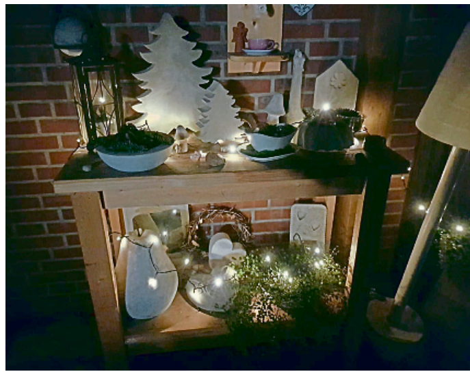
Auf dem Bispinghof findet am nächsten Wochenende ein Kunsthandwerkermarkt statt.