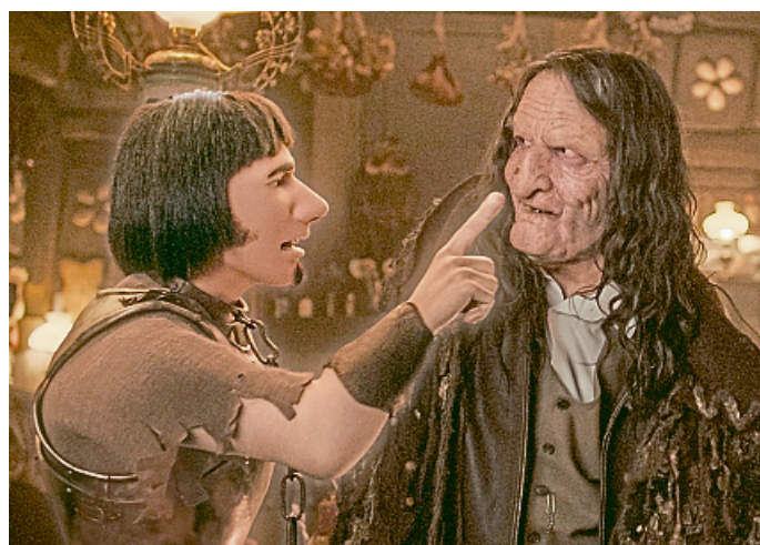
Das Gespenst Hui Buh verschlägt es diesmal in einen waschechten Hexenwald.

FAZIT: ★★★★★ Als Schlossgespenst Hui Buh spukt Michael „Bully“ Herbig diesen Herbst wieder in den Kinos. Der Kinderfilmklassiker kehrt in einer Fortsetzung mit alten und neuen Gesichtern zurück – diesmal geht es in den Hexenwald.