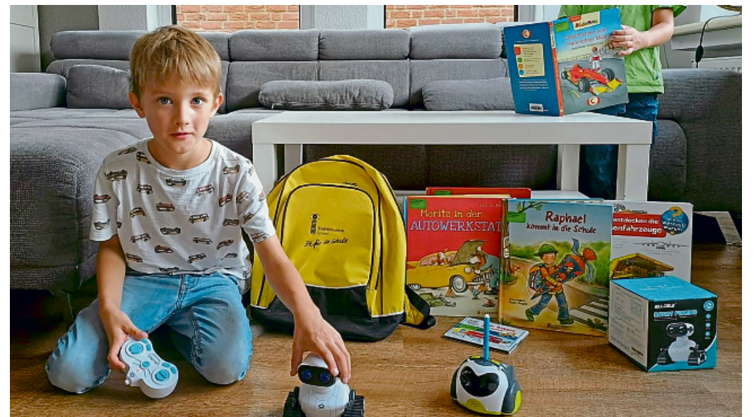
Rucksäcke mit Büchern zu verschiedenen Themen können in der Stadtbibliothek ausgeliehen werden.

merkung kostenlos. So erhalten alle Grevenener Kinder bis zur Einschulung im Sommer ihren Rucksack in der Stadtbibliothek, können sich die Geschichten vorlesen lassen und mit den Robotern experimentieren.