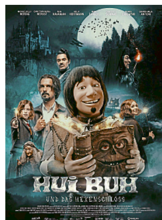
„Hui Buh und das Hexenschloss“ Kinderfilm

manchmal etwas flach kommen und sich an Klischees bedienen, ist der Humor durchaus kindgerecht. (dpa)