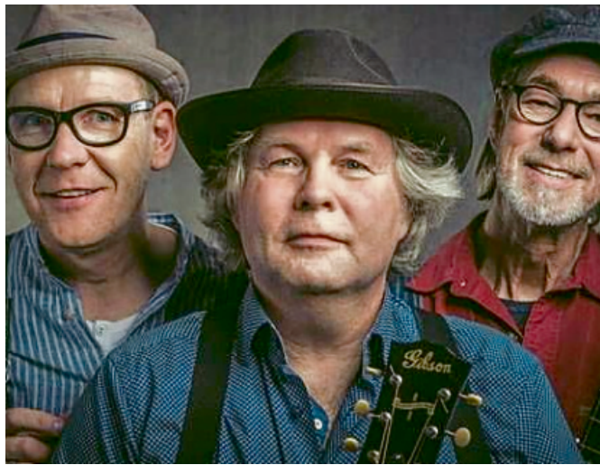
Die drei Vollblutblueser aus dem Münsterland.

GREVEN. Im dritten Anlauf wird es nun endlich klappen: Hootin' the Blues, in den vergangenen Jahren von Coronabeschränkungen ausgebremst, zelebrieren am Samstag, 12. November, um 20 Uhr in der Kulturschmiede unplugged den Blues. Das vielseitige Trio hält sich nicht streng an das Genre, sondern lässt auch benachbarte Musikstile einfließen. Hootin' the Blues spielt Goodtime Music. Das ist akustischer Blues, aber auch Ragtime, Country, Bluegrass und Jazz. Auch Mambo, Swing, Soul und Rock spielen wichtige Rollen. Neben akustischen Gitarren in al-