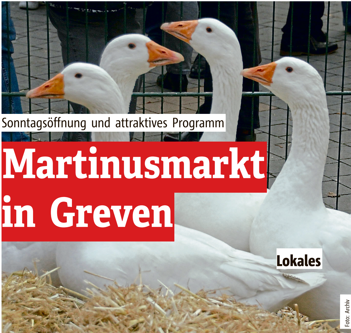
Sonntagsöffnung und attraktives Programm