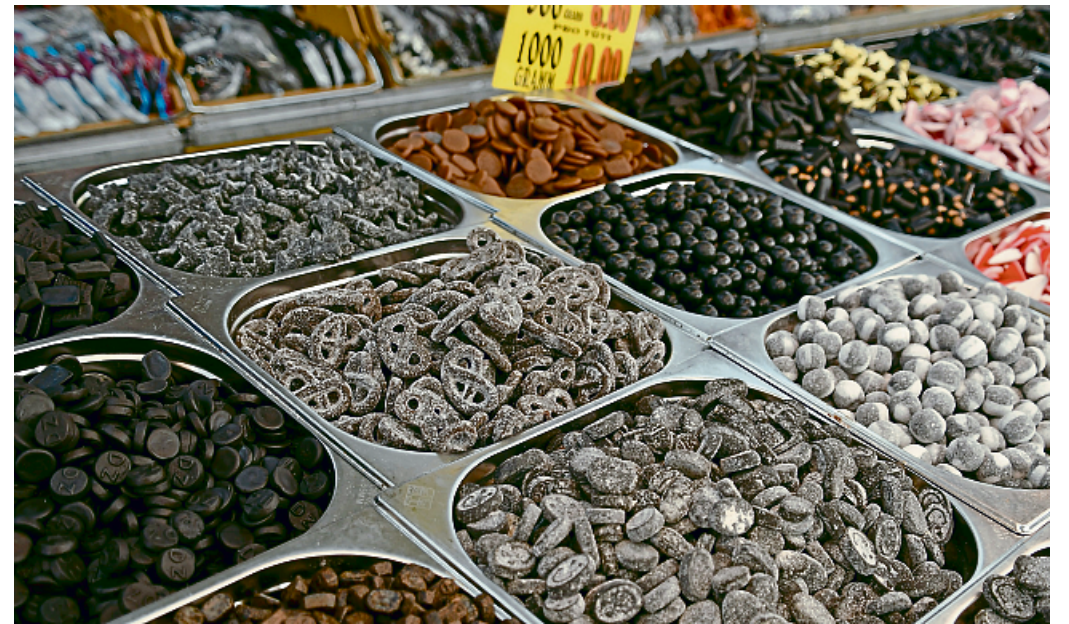
Holländisches Lakritz – die Leckerli gehören seit 30 Jahren zum Angebot beim traditionellen Hollandmarkt.