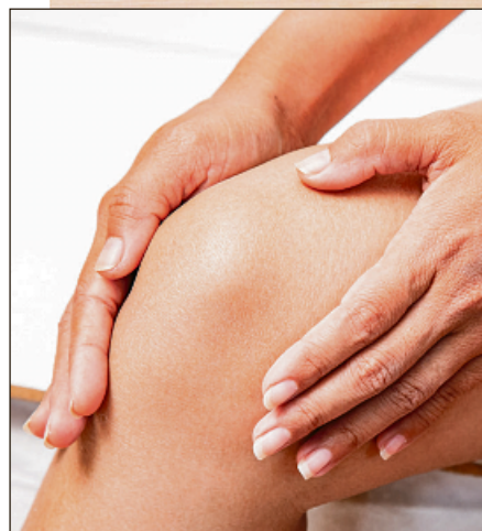
Das CBD Gel enthält Menthol und Minzöl für beanspruchte Muskeln.

aufwendig im Rubaxx Cannabis CBD Gel aufbereitet. Neben ~ 600 mg CBD enthält das Gel zudem Menthol und Minzöl zur Pflege beanspruchter Muskeln und für einen kühlenden Effekt.