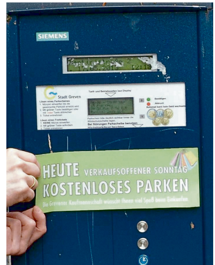
Mehr als 1000 kostenlose Parkplätze sorgen im Innenstadtbereich für eine entspannte Anreise.

Informationen dazu und auch den detaillierten Busfahrplan gibt es auch im Internet unter: www.stadtwerke-greven.de. Und für die Autofahrer stehen wie gewohnt über 1000 kostenlose Parkplätze im Innenstadtbereich zur Verfügung.